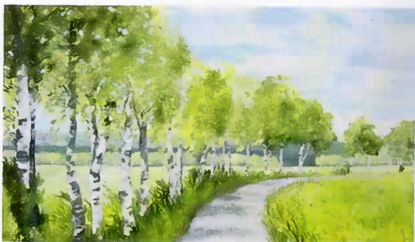
Birken, Öl auf Leinwand, 55x95cm

An einem Sommermorgen, da nimm den Wanderstab. Es fallen alle Sorgen wie Nebel von dir ab. (Th.Fontane)