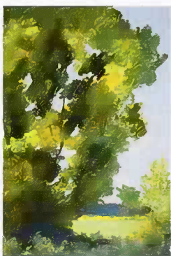
Silberweide Oilstick auf Karton, 21x14cm

Unmittelbare Sinneserfahrung der Natur und intensives Naturstudium – Topographie, Flora, Wolken – geben die Impulse zu meinen Bildern.