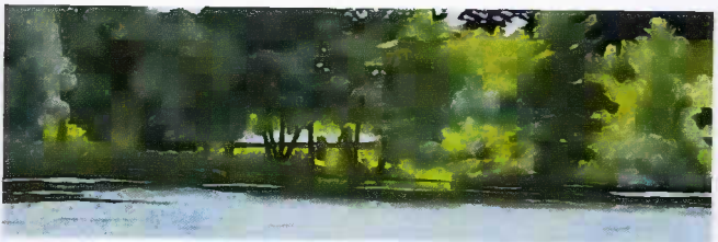
Seeufer, Öl auf Leinwand, 30x90cm