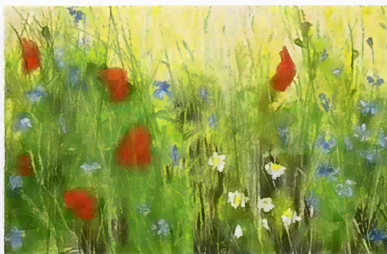
Mohn, Öl auf Leinwand, 40x60cm

Die vor Ort entstandenen Skizzen verdichte ich im Atelier zu durchkomponierten Ölbildern von kraftvoller Farbigkeit und intensiver Vitalität.