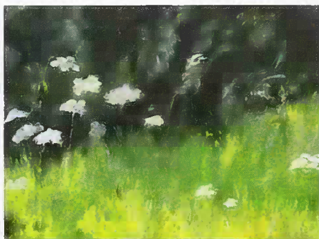
Wiesensaum, Öl auf Leinwand, 30x40cm

Die vor Ort entstandenen Skizzen verdichte ich im Atelier zu durchkomponierten Ölbildern von kraftvoller Farbigkeit und intensiver Vitalität.